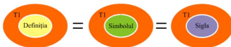
Graful 2. Raporturile sinonimice între termen și diferite forme de exprimare ale lui.

Astfel, în terminologia dreptului comunitar se stabilesc raporturi sinonimice: